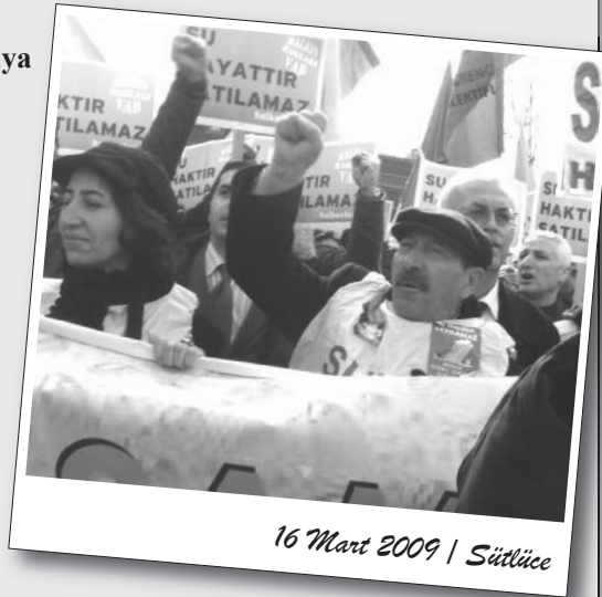
16 Mart 2009 | Sütlüce

Gözaltıların serbest bırakılması için bekleyişini sürdüren kitleye polis tekrar saldırdı. Çatışmalar ara sokaklarda devam etti.