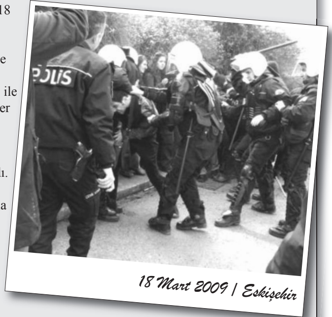
18 Mart 2009 | Eskişehir

Burada bir grup sivil faşist ve polis barikatıyla karşılaşıldı. Bir süre bekledikten sonra polis, kitle dağılmadığı durumda müdahale edeceğini belirtti. Bunun üzerine kitle sloganlarla beklemeye devam etti. Çok geçmeden ara sokakta taşlarla, sopalarla, satırla bekleyen sivil faşistler polisin yönlendirmesiyle ve polisle eşzamanlı olarak saldırdı. Gözaltına alınanlardan 26’sının faşist olduğu, fakat üzerlerinden “suç aleti” çıkmadığı için serbest bırakıldığı öğrenildi.